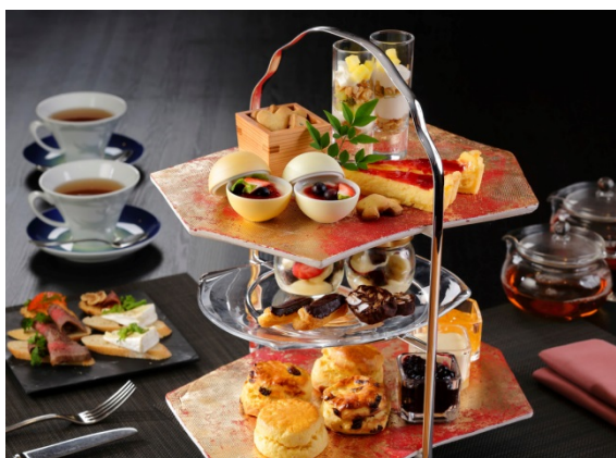
3段のアフタヌーンティー。優雅な午後のひと時に。

内容：アーティストルーム3室をご見学の後、25Fのアートラウンジでアフタヌーンティーをお楽しみいただきます。ご宿泊はアーティストルームに無料アップグレード。