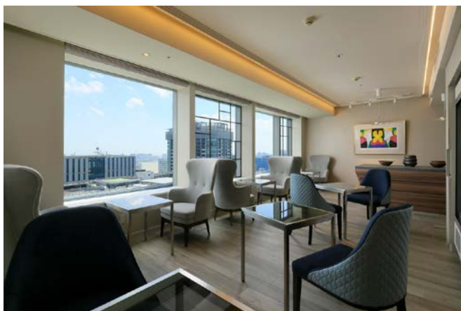
31F 専用の「ギャラリールーム」