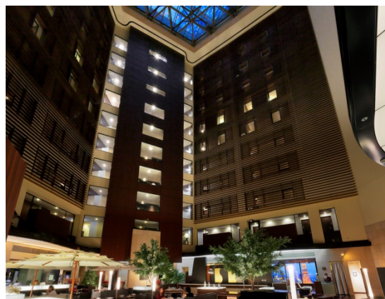
25Fから34Fまで吹き抜けのアートラウンジは解放感たっぷり。